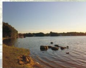
Schwielochsee 9 km