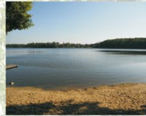
Groß Leuthener See 4 km